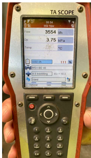
Illustration nr. 2 herover viser et udsnit af dokumentation for indregulering.