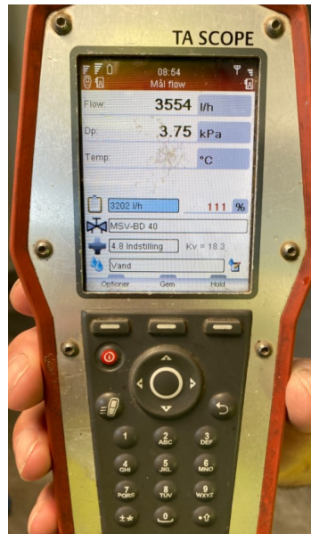
Illustration nr. 2 herover viser et eksempel på dokumentation for udført performancetest. TA-SCOPE er brugt til selve indreguleringen og bruges igen til de stikprøver som indgår i performancetesten.